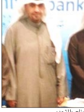
أنس الصالح وعدنان البليبي في زيارة جناح «المتحد»

أعلن البنك الأهلي المتحد عن مشاركته في رعاية ورشة عمل لدعم وتطوير المشاريع الصغيرة، التي نظمتها مركز «تساهيل» لتطوير ودعم المشاريع الصغيرة، في جامعة الخليج بمشرف في 23 و 24 ديسمبر الماضي برعاية وحضور وزير التجارة والصناعة أنس الصالح. حيث جاءت مشاركة «المتحد» في إطار مسؤوليته المجتمعية، ودوره البارز كمؤسسة رائدة في مجال العمل الاجتماعي في الكويت، وحرصه على القيام بدور فعال في تقديم الدعم والمبادرات التي تساعد على النهوض بالقطاع وبالاقتصاد الوطني. وبهذه المناسبة أفساد البنك الأهلي المتحد في بيان صحافي بأن «هذه المشاركة تأتي ضمن جهودنا الحثيثة لدعم المشاريع الصغيرة في الكويت نظرا لما لهذه المشاريع من دور حيوي في المساهمة في النمو الاقتصادي والاجتماعي، ونحن في البنك الأهلي المتحد لدينا رؤية كبيرة وفهم عميق لأهمية الدور الذي يلعبه قطاع المشاريع الصغيرة والمتوسطة