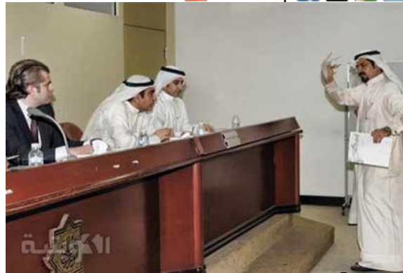
عمومية نور للاتصالات